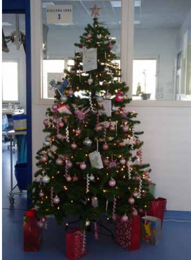
↑ Novoletna smreka v DC Nefrodial Naklo.