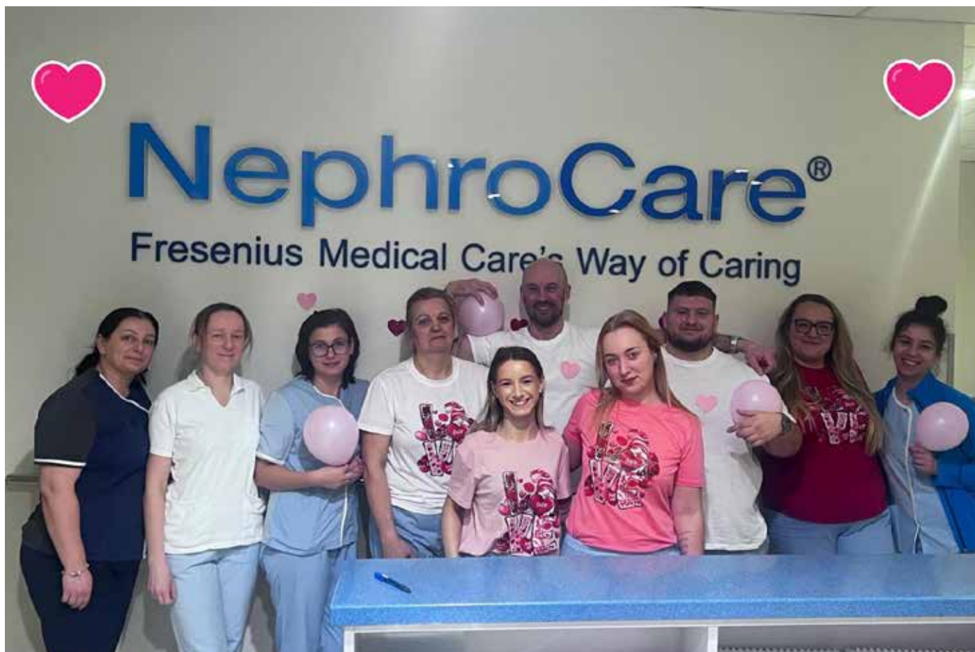
↑ Obisk Valentinčka v DC Nefrodial Črnuče.