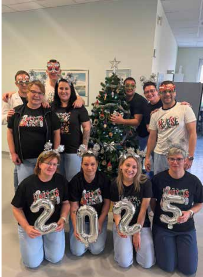
↑ Veselo vzdušje ob prehodu v leto 2025 v DC Nefrodial Dragomer.