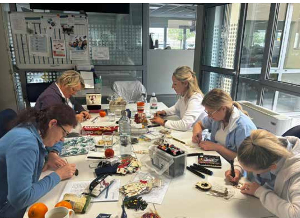
↑ Ustvarjanje novoletnih okrasov v DC Dragomer.