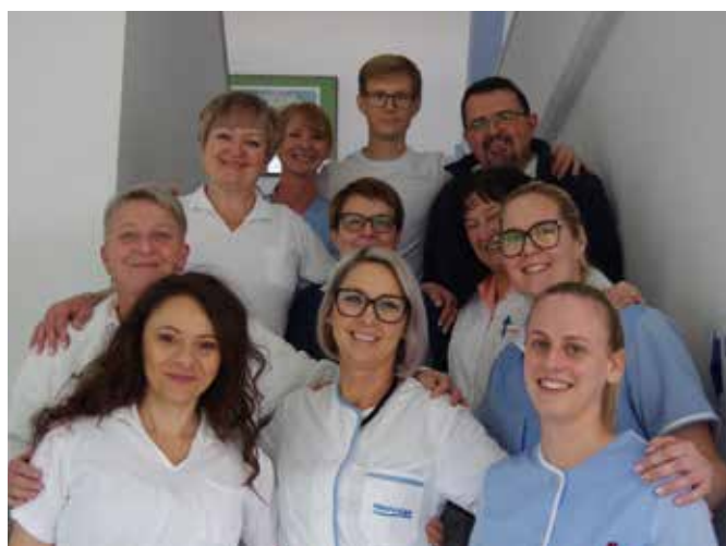
↑ Del ekipe iz DC Nefrodial Celje.