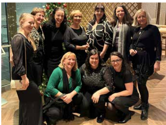
↑ Del ekipe iz DC Nefrodial Krško na 30 obletnici Nefrodiala.